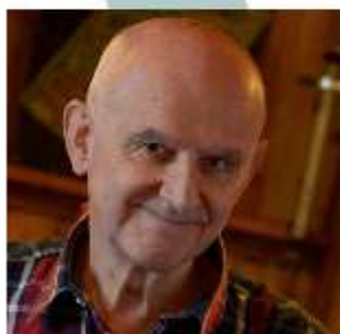
Dan Ar Braz